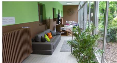
MARADJA (MAISON AQUITAINE RESSOURCES POUR ADOLESCENTS ET JEUNES ADULTES)