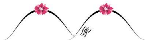
Un criblage de petits plis...