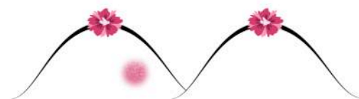
Une peau d'orange...