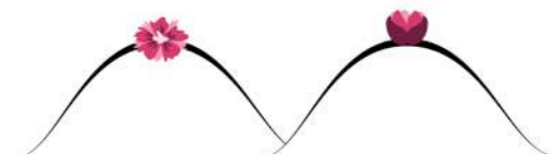
Un téton rétracté...

N'oubliez pas les consultations de gynécologie recommandées aux femmes tous les ans et le dépistage organisé à partir de 50 ans.