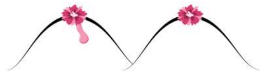
Un liquide qui s'écoule...