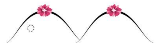
Une grosseur invisible...