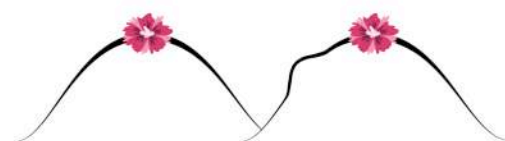
Une masse épaisse...