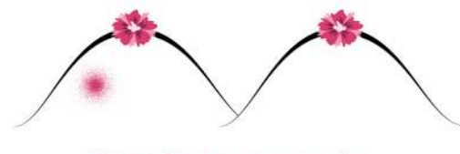
Une érosion cutanée...