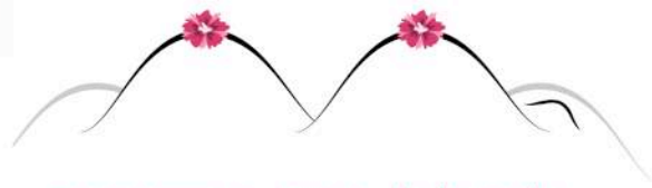
Une masse au niveau de l'aisselle...

En plus de vos consultations régulières, si vous remarquez un de ces signes, il est important de consulter un médecin.