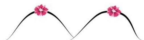
Un changement de taille, de forme...